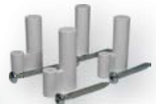
rögzítő elem gipszkarton falhoz